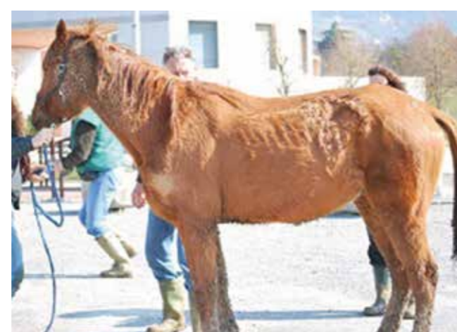
Bouc Bel Aire