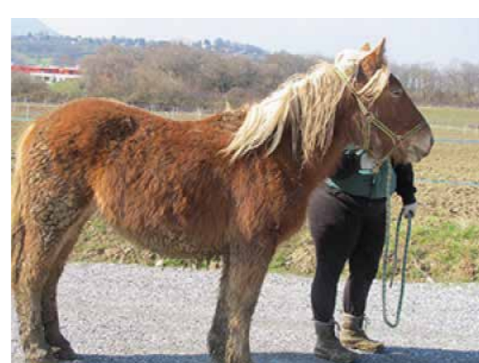
Danaïde de Payolle