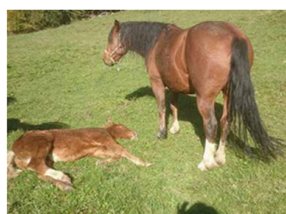
Astérix et Myrtille