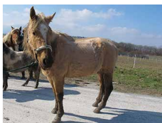
All Way Doc Sanitas