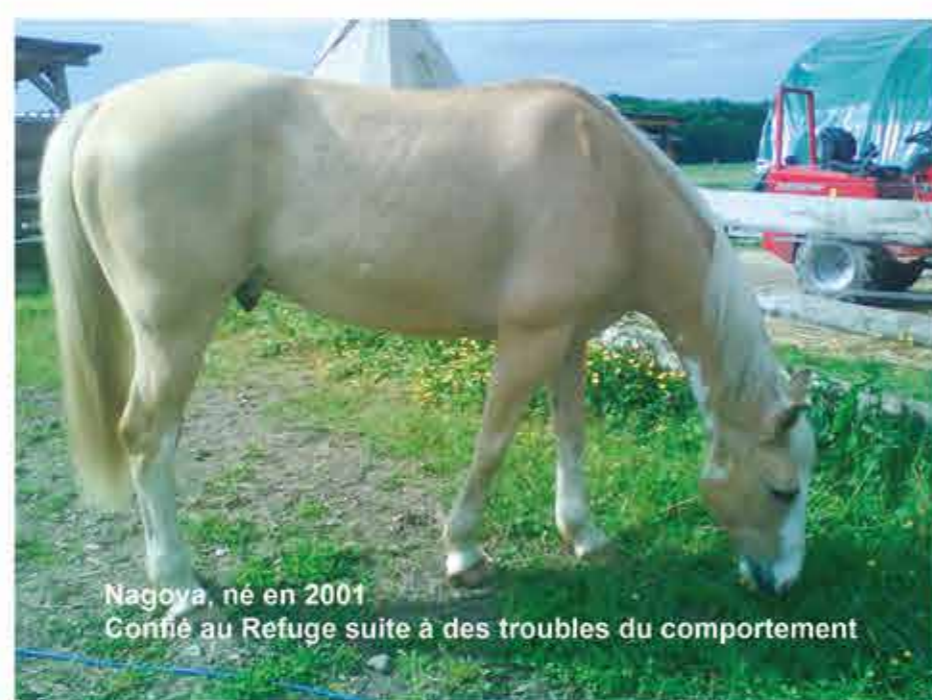
Nagoya, né en 2001 Confié au Refuge suite à des troubles du comportement