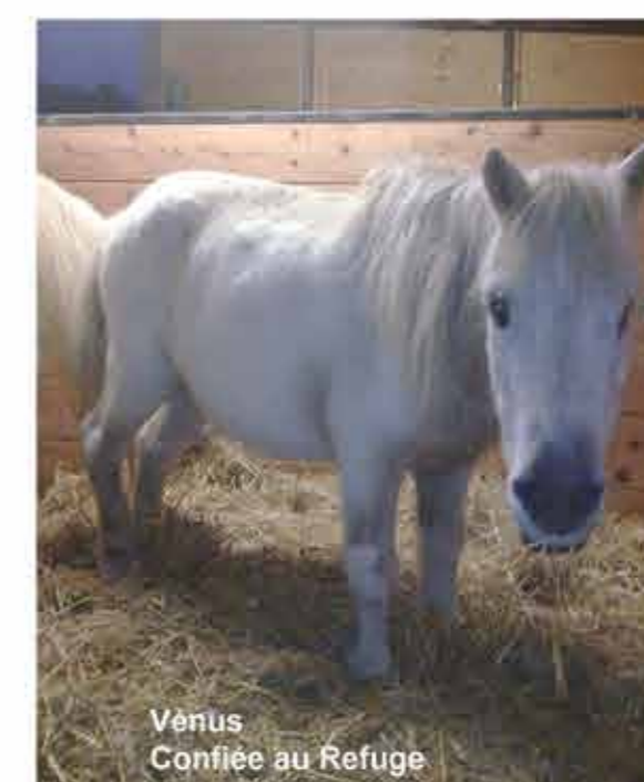
Venus Confiée au Refuge