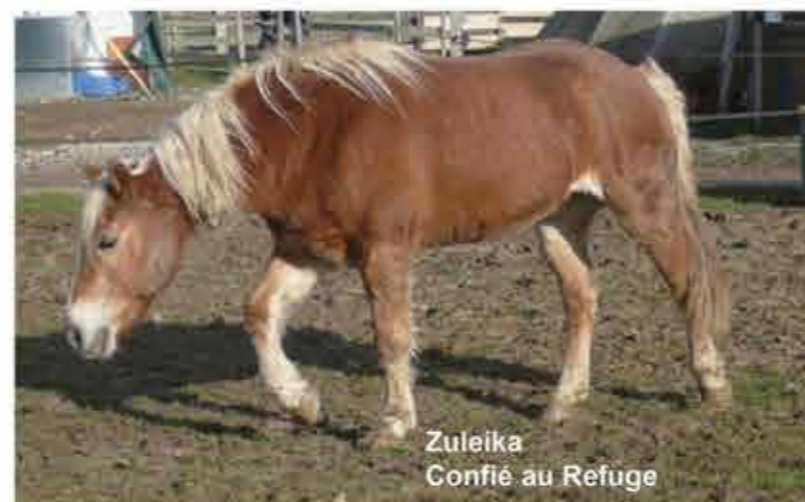
Zuleika Confié au Refuge