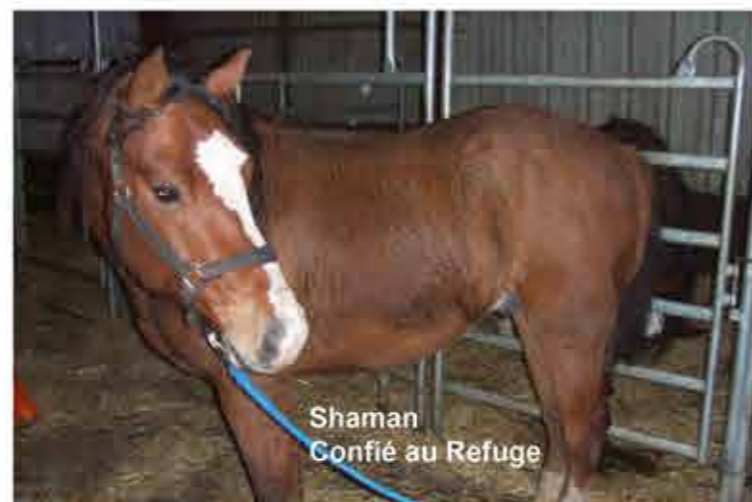
Shaman Confié au Refuge