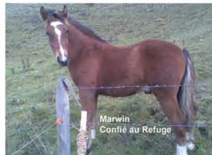
Marwin Confié au Refuge