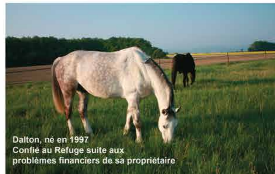
Dalton, né en 1997 Confié au Refuge suite aux problèmes financiers de sa propriétaire