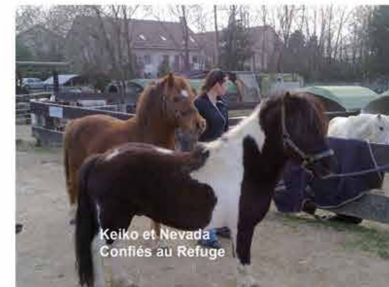
Keiko et Nevada Confiés au Refuge