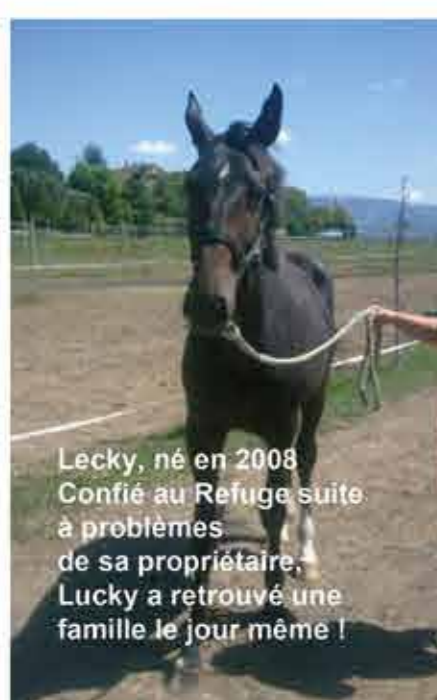
Lucky, né en 2008 Confié au Refuge suite à problèmes de sa propriétaire. Lucky a retrouvé une famille le jour même !