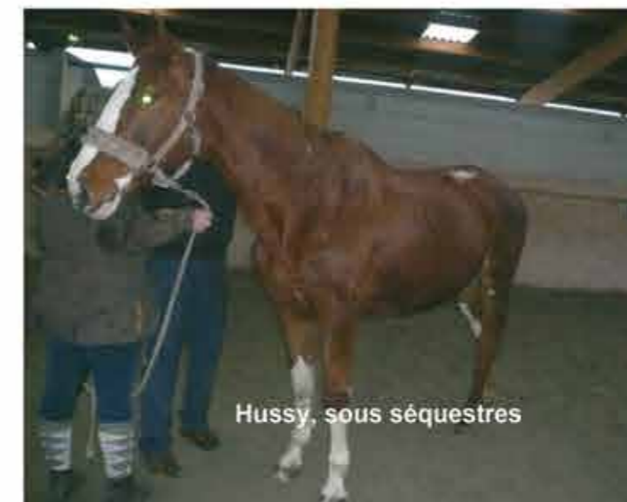
Hussy, sous séquestres