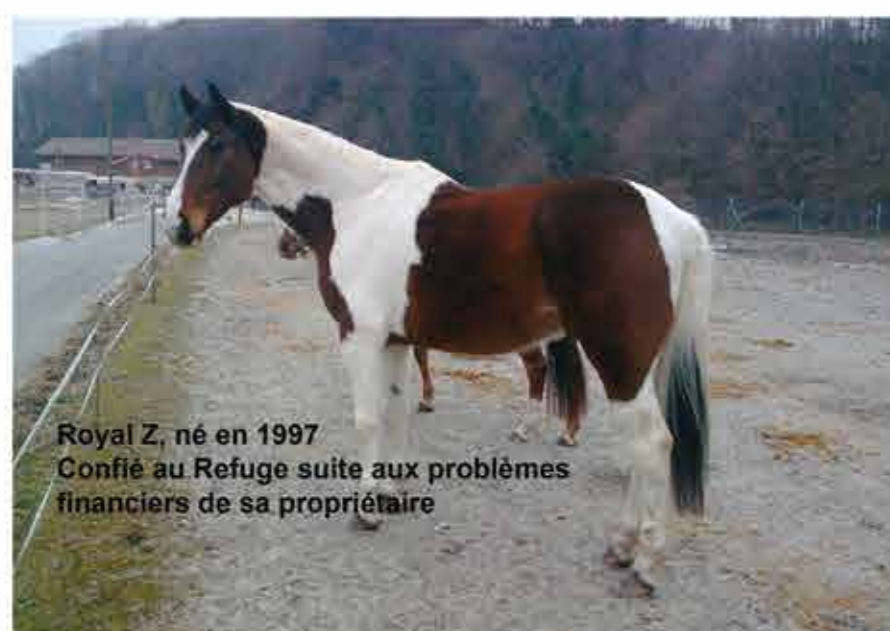
Royal Z, né en 1997 Confié au Refuge suite aux problèmes financiers de sa propriétaire