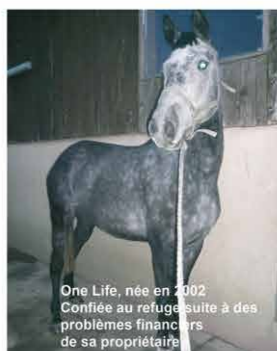
One Life, née en 2002 Confiée au refuge suite à des problèmes financiers de sa propriétaire