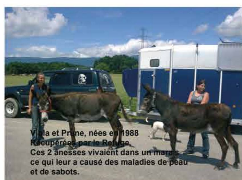
Villa et Prine, nées en 1988 Récupérées par le Refuge. Ces 2 ânesses vivaient dans un manège ce qui leur a causé des maladies de peau et de sabots.