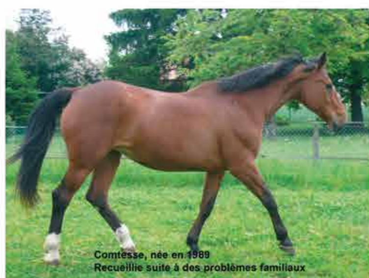
Comtesse, née en 1988 Recueillie suite à des problèmes familiaux