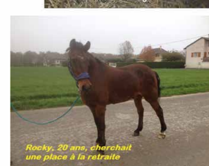
Rocky, 20 ans, cherche une place à la retraite