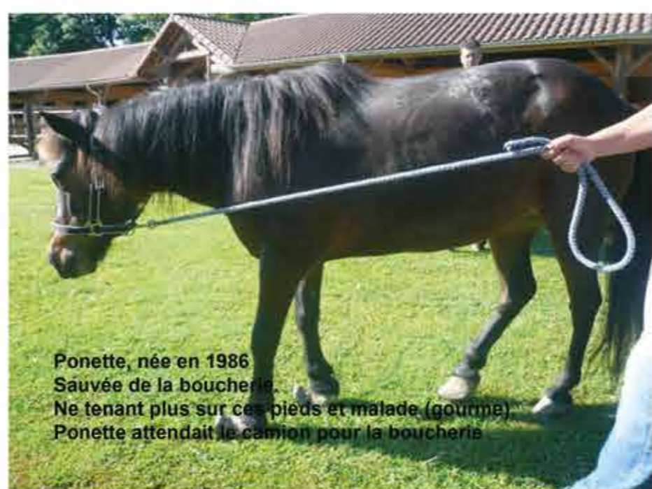
Ponette, née en 1986 Sauvée de la boucherie. Ne tenant plus sur ses pieds et malade (gourme) Ponette attendait le camion pour la boucherie