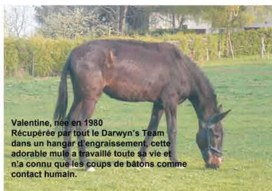
Valentine, née en 1980 Récupérée par tout le Darwyn's Team dans un hangar d'engraissement, cette adorable mule a travaillé toute sa vie et n'a connu que les coups de bâtons comme contact humain.