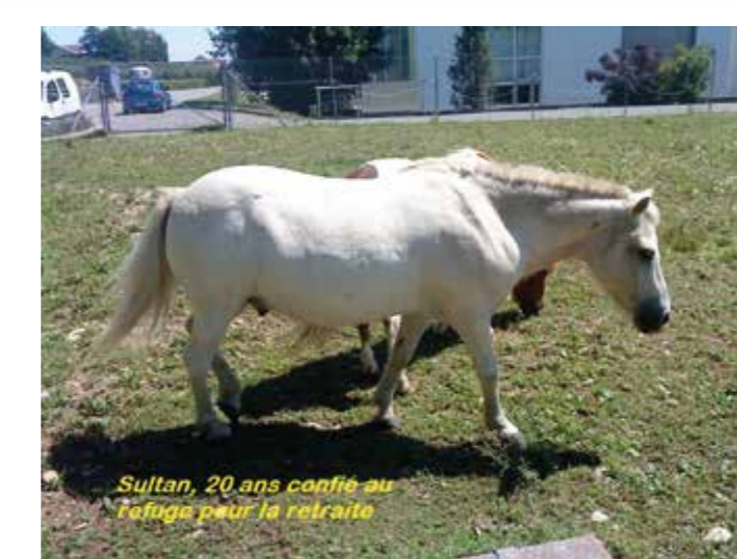
Sultan, 20 ans confié au Refuge pour la retraite